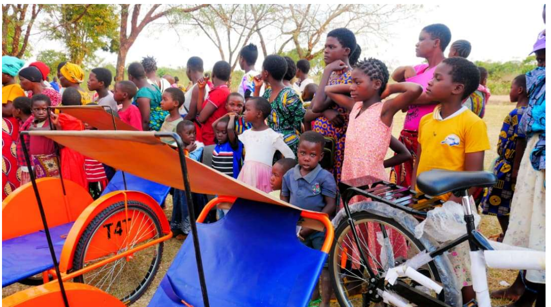
Een groot distributiefest, altijd gepaard met zang en dansen.