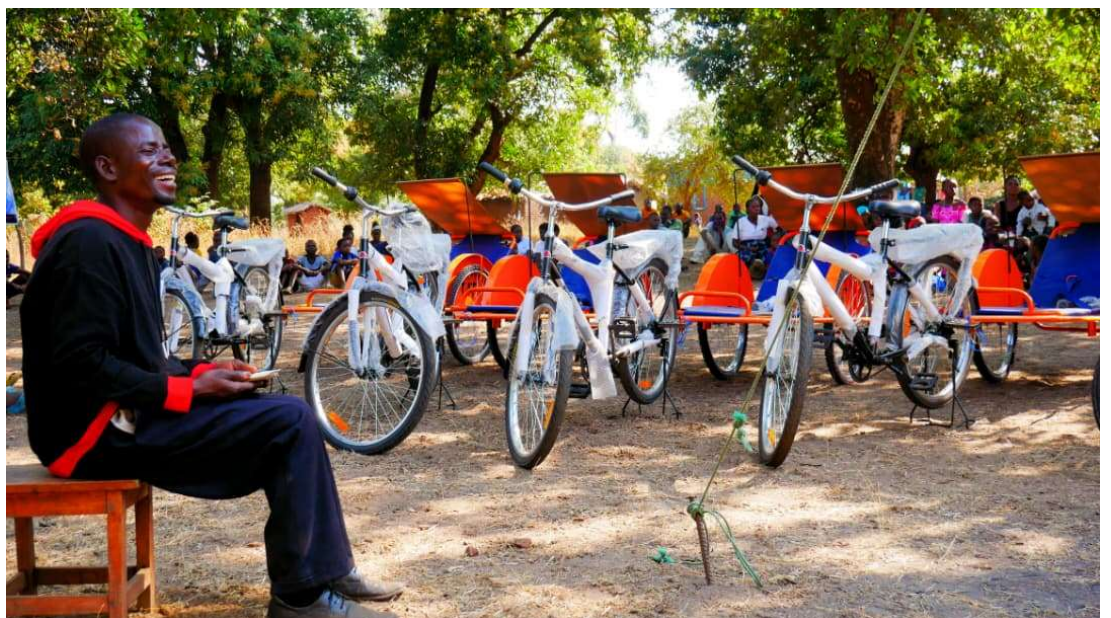
Geassembleerde fiets ambulances.