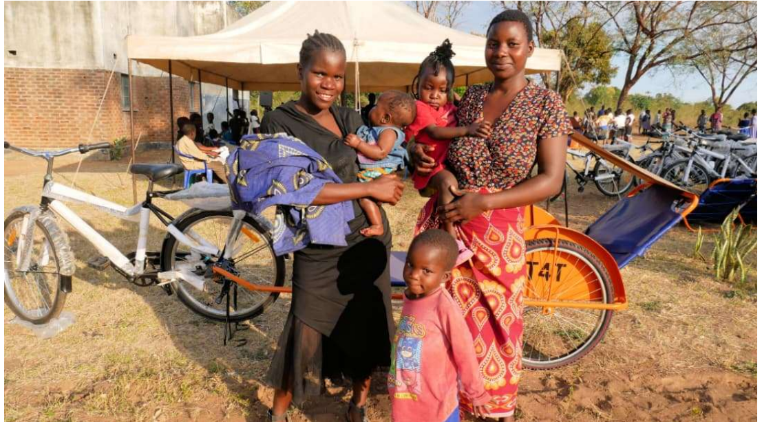
Hele jonge moeders in Mthumba Village Balaka district.