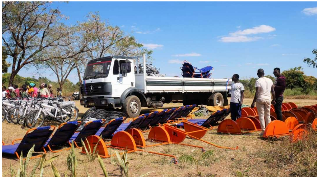
Vorbereiding middels assemblage voor de distributie.