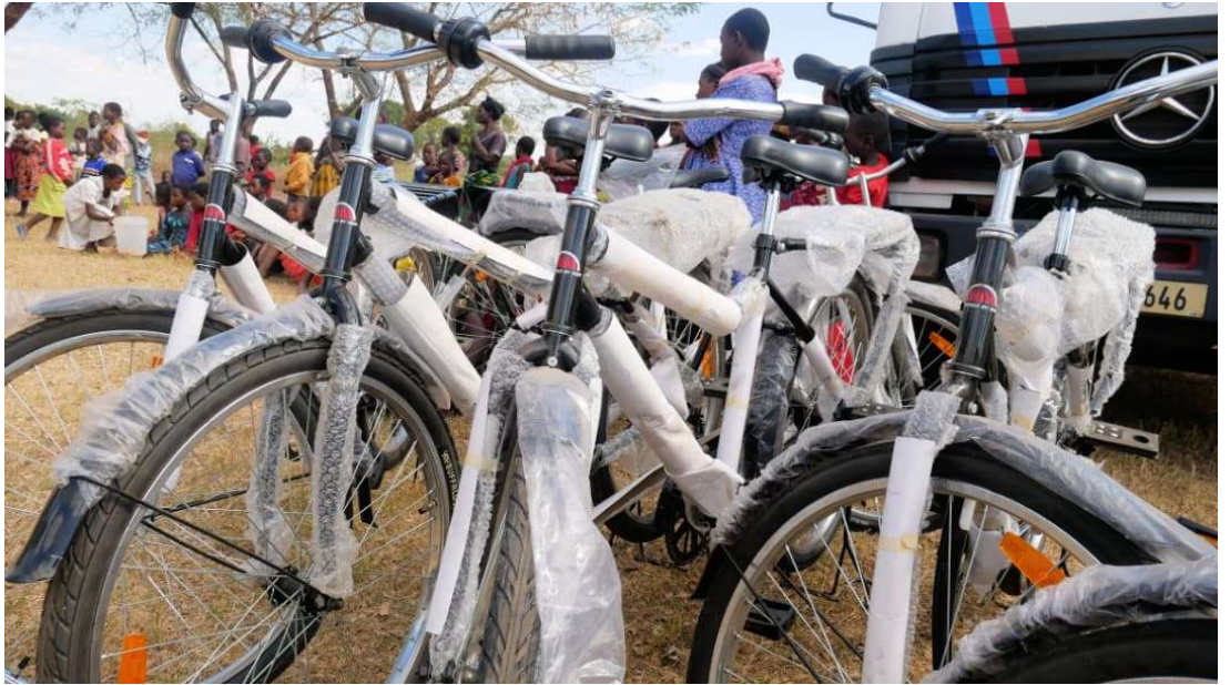
De fietsen worden geïmporteerd uit Zimbabwe, deze zijn sterker dan uit Malawi.