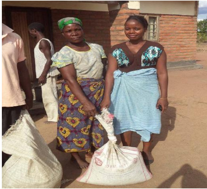
Voor het gastenverblijf werd het mais uitgedeeld aan de vrouwen van Mthumba village.