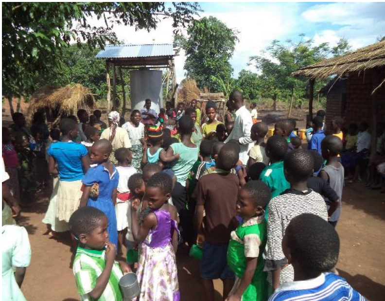
Ook werd er een kerstmaaltijd georganiseerd, waarbij de kinderen, naast eten, ook een soort ranja kregen..