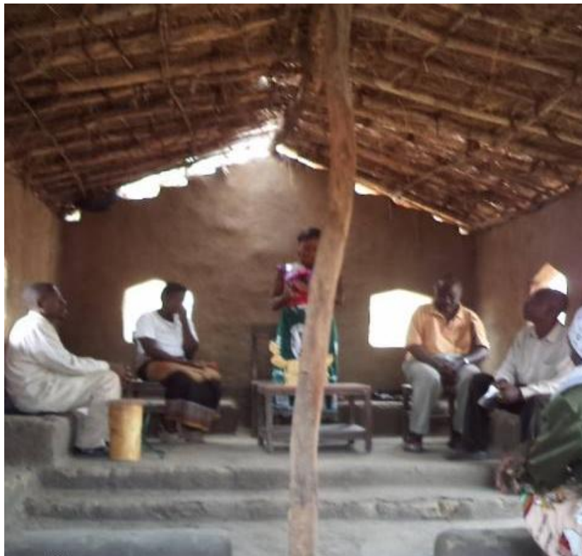
Een kerkje op het platteland